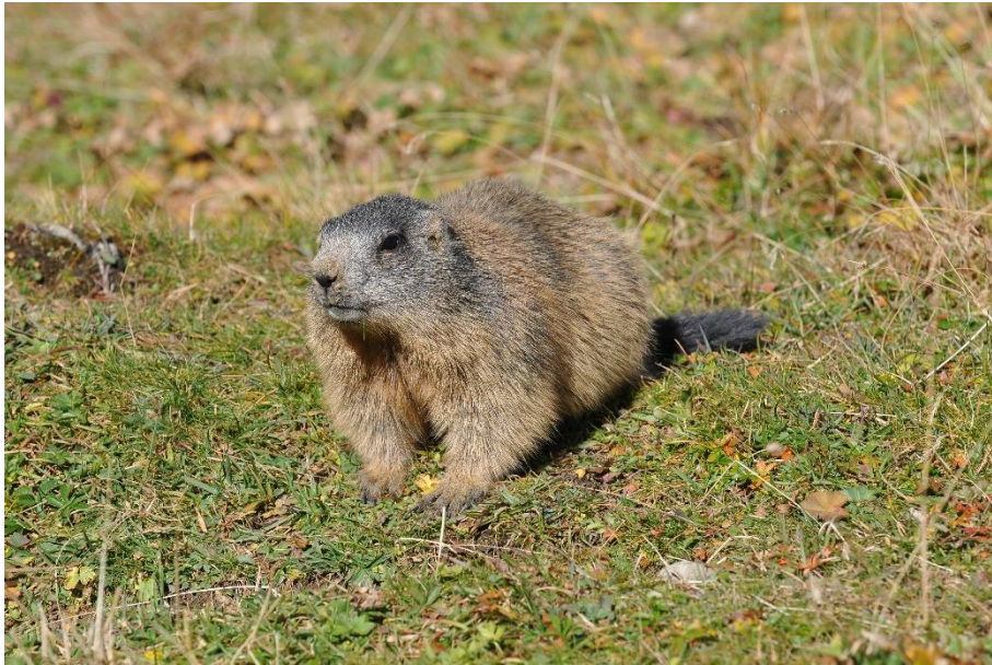
Alpenmurmeltier ( Marmota marmota ).

Alpenmurmeltiere ( Marmota marmota ) halten einen mehrmonatigen Winterschlaf, wo sie ihren Stoffwechsel stark nach unten drehen und von ihren Fettreserven leben.