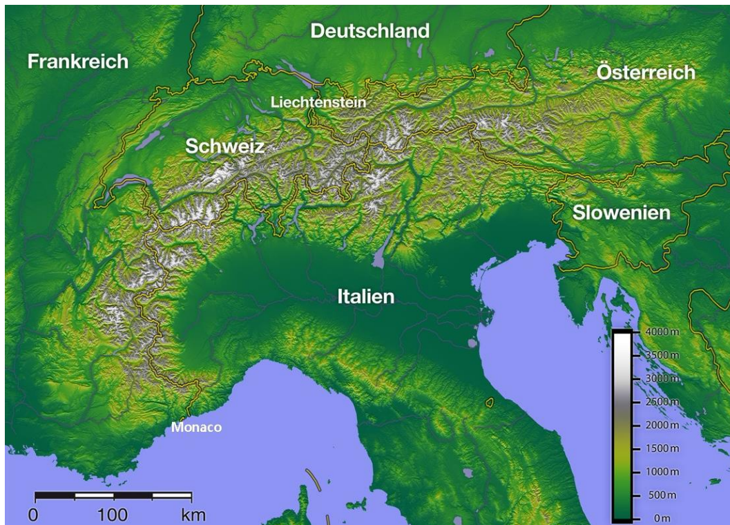
Die Alpen mit den Staatsgrenzen.

Die Alpen erstrecken sich auf über 1200 km von der Cote d'Azur in Frankreich bis in den Osten Österreichs. Auf einer Breite von 150 bis 250 km weisen sie viele imposante Gipfel auf. Der höchste Gipfel ist der Mont Blanc bzw. Monte Bianco mit seinen 4810 m und befindet sich an der Grenze zwischen Frankreich und Italien. Acht Staaten haben Anteil an den Alpen. Aufgeteilt werden die Alpen in West- und Ostalpen . Die Grenze zwischen diesen beiden Einheiten verläuft vom Bodensee entlang des Rheins bis zum Comer See. Die Westalpen weisen höhere Berge als die Ostalpen auf. Südtirol befindet sich in den Ostalpen.