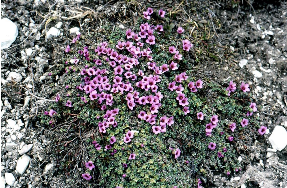
Gegenblättriger Steinbrech ( Saxifraga oppositifolia ).

Schnee bedeckt sind, sind sie außerdem von der stärksten Kälte isoliert. Beeindruckende Vertreter, die trotz ihres kleinen Habitus prächtige Blüten bilden, sind das Polster- oder Stängellose Leimkraut ( Silene acaulis ), verschiedene Steinbrech-Arten ( Saxifraga sp. ) sowie einige Mannschild-Arten ( Androsace sp. ). Zu den Polsterpflanzen gehört auch der Rekordhalter unter den höchststeigenden Blütenpflanzen der Alpen: Der Gegenblättrige Steinbrech ( Saxifraga oppositifolia ) kommt am Dom im Wallis (Schweiz) noch auf 4505 m Meereshöhe vor.