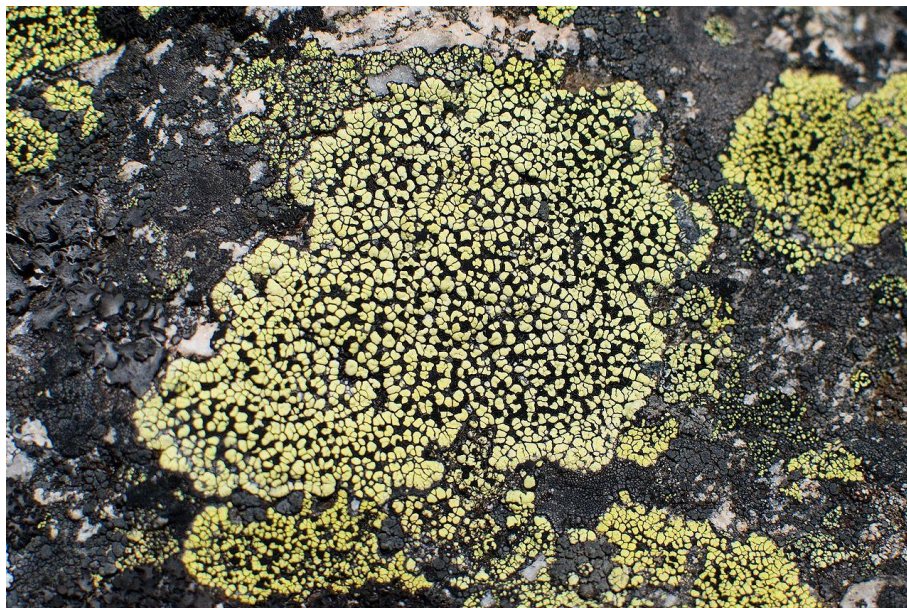
Die Landkartenflechte ( Rhizocarpon geographicum ), eine Krustenflechte. Wikimedia commons

Wo keine Blütenpflanzen mehr überleben können, sind viele Felsspalten noch mit Moosen oder Krustenflechten besiedelt.