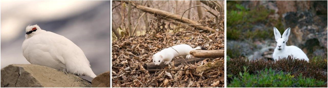
Alpenschneehuhn ( Lagopus muta ), Hermelin ( Mustela erminea ) und Schneehase ( Lepus timidus ).

Weitere beeindruckende Alpentiere sind das Birk- ( Lyrurus tetrrix ) und das Auerhuhn ( Tetrao urogallos ), der Steinadler ( Aquila chrysaetos ) sowie unser Vogel mit der größten Flügelspannweite, der Bartgeier ( Gypaetus barbatus ).