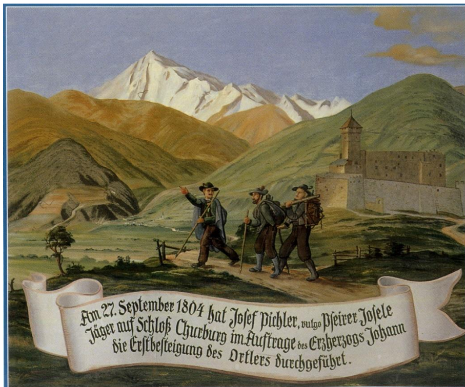
Die Erstbesteigung des Ortlers. Bild auf der Churburg (Schluderns).