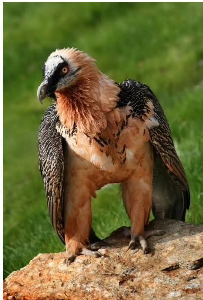
Bartgeier ( Gypaetus barbatus ). Wikimedia commons

Weitere beeindruckende Alpentiere sind das Birk- ( Lyrurus tetrrix ) und das Auerhuhn ( Tetrao urogallos ), der Steinadler ( Aquila chrysaetos ) sowie unser Vogel mit der größten Flügelspannweite, der Bartgeier ( Gypaetus barbatus ).