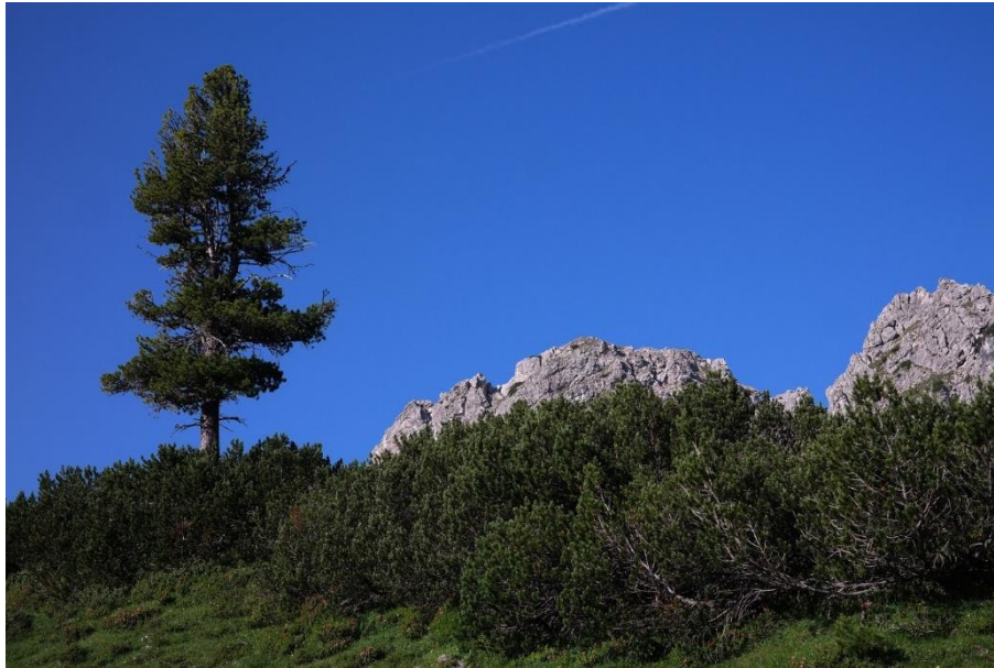
Zirbe ( Pinus cembra ) und Latsche ( Pinus mugo subsp. mugo ).

Die Schutzzonen zu Fuße der Felswände werden von sogenannten Schuttwanderer , Schuttdecker , Schuttüberkriecher oder Schuttstrecker besiedelt. Dazu zählen in Südtirol u. a. das Rundblättrige Täschelkraut ( Noccaea rotundifolia ) und der Alpen-Mohn ( Papaver alpinum subsp. rhaeticum ). Durch eine kräftige Pfahlwurzel und durch den Schutt kriechende Triebe kann dieses Täschelkraut auch in sehr beweglichem Schutt überleben.