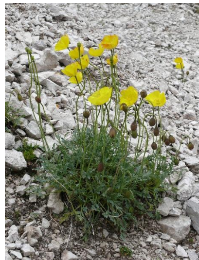
Rundblättriges Täschelkraut ( Noccaea rotundifolia ) und Alpen-Mohn ( Papaver alpinum subsp. rhaeticum ).

Eine weitere Anpassung an hochalpine Gegenden sind die Polsterpflanzen . In Schuttflächen und Felsspalten dringen sie mit ihrer Pfahlwurzel tief ins Gestein. Durch ihre Höhe von wenigen Zentimeter sind sie weniger stark den Umweltbedingungen ausgesetzt, bilden durch den Polsterwuchs ein eigenes Mikroklima und produzieren außerdem durch die im Inneren abgestorbenen Blätter Eigenhumus. Sobald sie vom